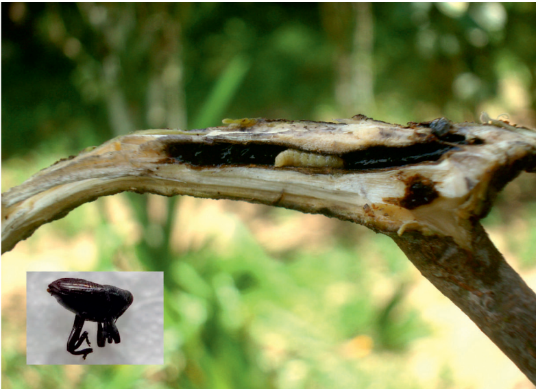
Figure 4. Macrocopturus cf. tristis , galerie ouverte et insecte adulte sur anacardier.