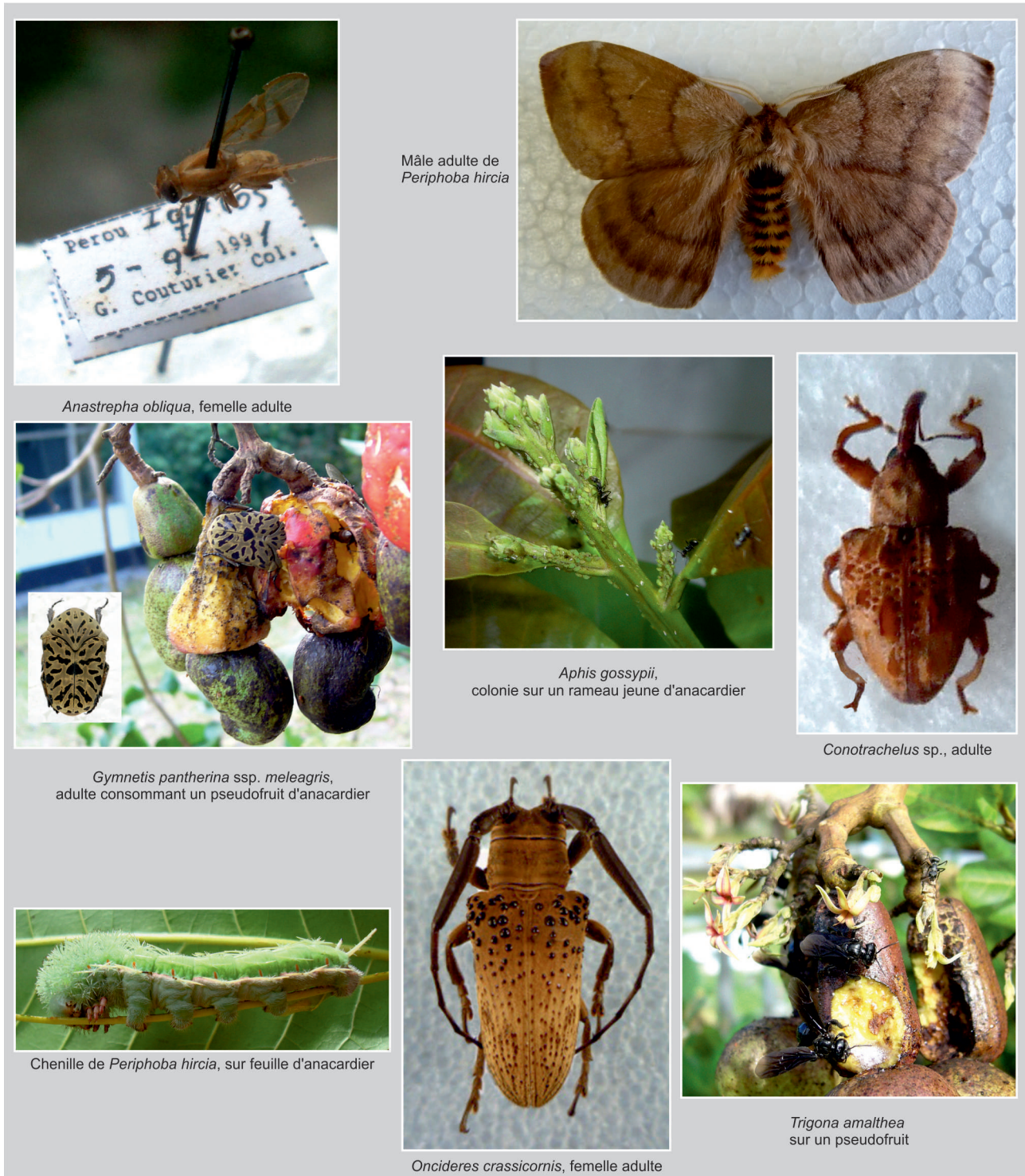
Figure 3. Divers ravageurs provoquant des dégâts plus ou moins importants sur anacardier au Pérou.