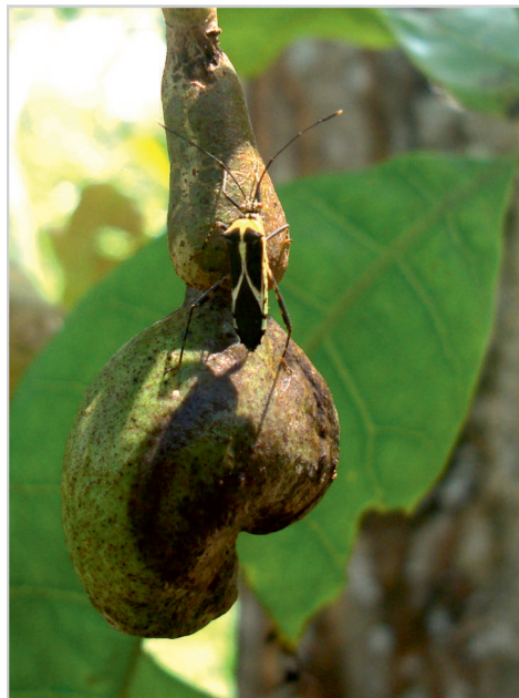
Figure 7. Adulte de Zoreva sp. piquant un pseudofruit d'anacardier.