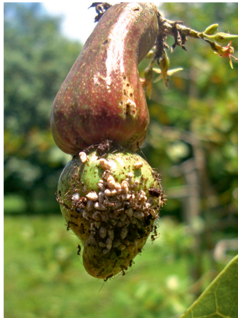
Figure 6. Jeunes de Membracis sp. sur fruit d'anacardier.

Larves et adultes de Zoreva sp. se rencontrent sur les pseudofruits où ils provoquent des nécroses. C'est une punaise de 15 mm de long de couleur jaune et brun-noir (figure 7). Cette espèce est rare sur l'anacardier et ne justifie pas d'intervention particulière.