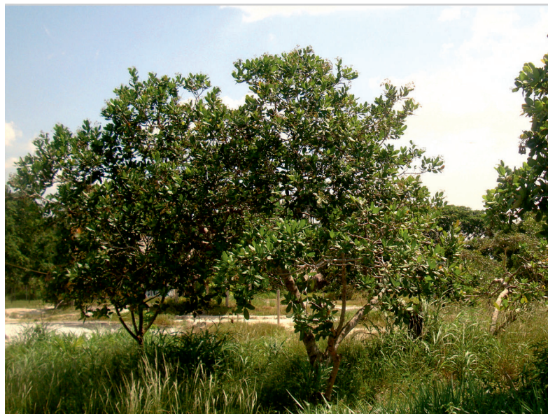
Figure 1. Anacardiers aux abords du village de Varillal (Pérou).

Anastrepha obliqua est une mouche des fruits mesurant 7 mm de long ; les ailes sont transparentes avec de larges bandes brun-jaune légèrement brunies (figure 3). C'est une espèce polyphage largement distribuée dans toute l'Amazonie et la zone néotropicale. Les femelles perforent l'épiderme du pseudofruit avec leur ovipositeur et y insèrent leurs œufs. Les larves se développent dans la pulpe du pseudofruit ; à leur complet développement elles mesurent 8 mm de longueur. Leur développement terminé les larves se laissent tomber au sol où elles s'empupent à faible profondeur. Ce sont des asticots qui ne doivent pas être confondus avec les larves de Conotrachelus sp. (voir ci-dessous). Comme pour ce dernier, le ramassage et la destruction des pseudofruits