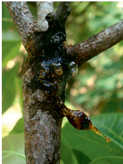
Figure 5. Exsudation de sève sur anacardier, due aux attaques de Macrocopturus cf. tristis .

à l'ouverture la galerie présente une coloration noire caractéristique (figure 4). Les branches sont fragilisées et peuvent casser sous l'effet du vent ou d'une forte charge en fruits. Les dégâts se remarquent facilement par la présence de boules de gomme. Ce ravageur ne semble pas avoir été signalé auparavant. Il a été rencontré pour