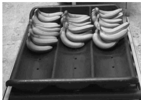
Figure 1. Tray classique : plateau en plastique (longueur : 84 cm, largeur : 70 cm, profondeur : 12 cm), présentant trois rangées alvéolées légèrement arrondies et percées (sept trous par rangées) afin d'éviter que la solution de traitement ne reste au fond.

Nous nous sommes intéressés à trois facteurs qui, au stade du hangar, peuvent influencer l'efficacité des applications de fongicides après-récoltes : l'emploi ou non d'alun, le temps d'application, le type et le débit des buses.