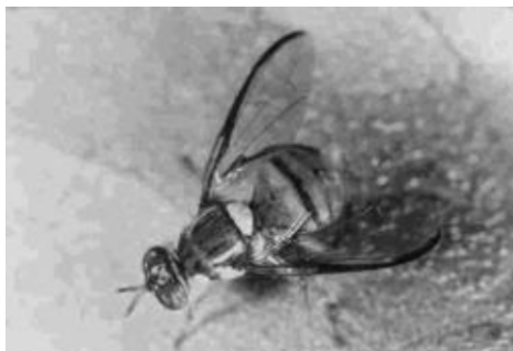
Figure 3. Adulte de Bactrocera tryonii , mouche des fruits la plus répandue en Polynésie française.

Dans les îles définitivement infestées par une ou plusieurs espèces de Bactrocera , les agriculteurs sont contraints d'adopter un système de lutte au moment de la maturation des fruits. L'ensemble des îles de la Société, infestées sur tout leur territoire par